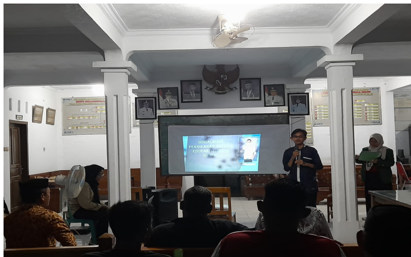
Gambar 2. Penyuluhan Literasi Digital anti Hoax, Bullying, dan Ujaran Kebencian

mengenali konten hoax , ujaran kebencian, dan bullying dan kemampuan mengidentifikasi sehingga terwujud etika dalam menggunakan media sosial yang santun dan bijaksana. Isian ini akan melihat perubahan pengetahuan mitra dalam mengetahui apa itu hoax , ujaran kebencian, dan bullying serta mengenali kontennya. Penyuluhan Literasi Digital anti Hoax, Bullying, dan Ujaran Kebencian seperti tampak di gambar 2 di bawah ini