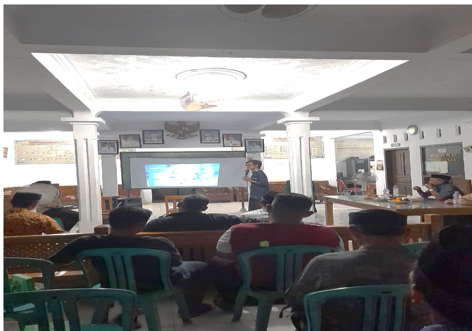
Gambar 1. Penyuluhan Literasi Digital anti Hoax, Bullying, dan Ujaran Kebencian

dan penyebaran informasi. WhatsApp dan Facebook digunakan oleh semua peserta yang hadir sedangkan Instagram dan telegram tidak semua peserta yang menggunakannya. Penyuluhan Penyuluhan Literasi Digital anti Hoax, Bullying, dan Ujaran Kebencian seperti terlihat di gambar 1