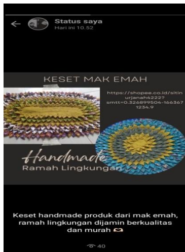
Gambar 9 Promosi di Whatsapp