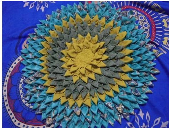
Gambar 7. Hasil