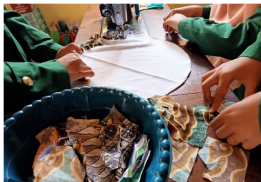
Gambar 5. Kain perca