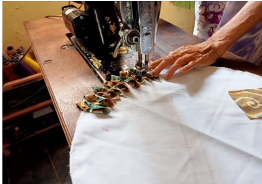
Gambar 6. Pola