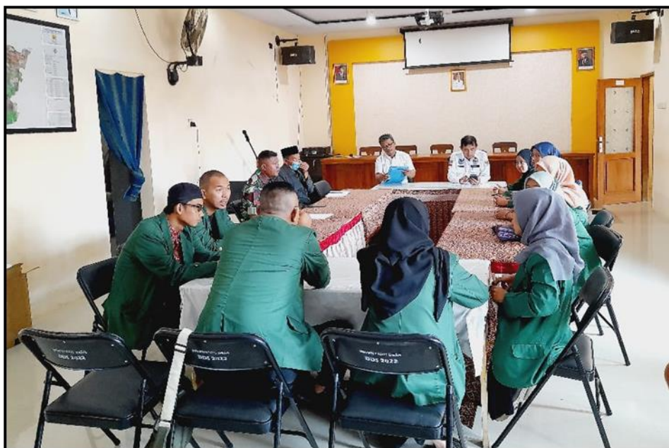
Gambar 11. Forum Diskusi dengan pemerintah desa