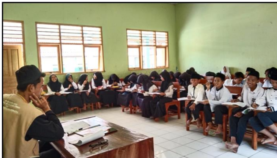
Gambar 3. KBM di kelas