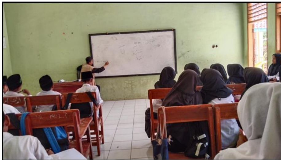
Gambar 1. Gambaran Ruang Kelas saat KBM

Hasil wawancara dengan guru - guru madrasah yaitu kurangnya fasilitas sarana prasarana di Madrasah Diniyah Mathla'ul Anwar karena tidak bisa mengajukan bantuan dan belum pernah mendapat bantuan anggaran dana rehabilitas maupun fasilitas dari pemerintah baik tingkat kabupaten, provinsi maupun pusat. Madrasah dibawah naungan pemerintah desa Panongan sehingga tidak bisa mendapatkan bantuan dari luar.