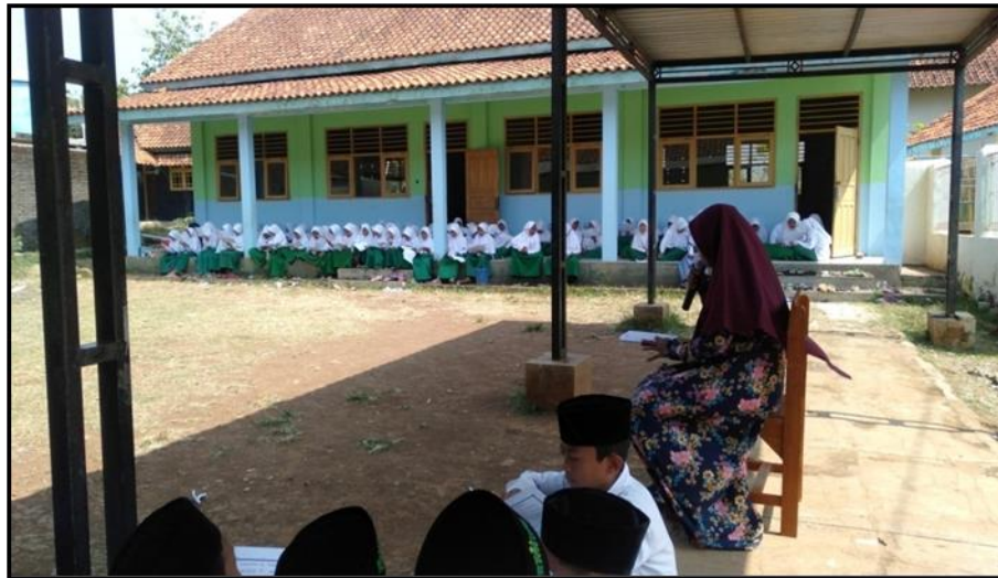
Gambar 2. Pembiasaan Sebelum KBM di Mulai